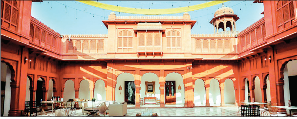
इसमें कलाकृतियां हैं जो हमारे मेहमानों को एक यादगार प्रवास देने के लिए क्लासिक और समकालीन सुविधाओं का मिश्रण हैं। डेस्टीनेशन वेडिंग, मीटिंग, और रोमांटिक रात्रिभोज के लिए यह एक शानदार जगह है। बीकानेर के

नई दिल्ली/एजेंसी। पूरे भारत में लोकल एक्सपेरियंस प्रदान करने के लिए जाने जाने वाले बृज होटल्स, राजस्थान में एक और उत्कृष्ट होटल खोलने की तैयारी कर रहे हैं। एक अक्टूबर से राजस्थान के बीकानेर में बृज गज केसरी, ब्रांड के आतिथ्य का आनंद लेने के लिए आगंतुकों का स्वागत करेंगे। बृज होटल्स लोकाचार के साथ संपत्ति का नवीनीकरण कर रहा है। बृज गज केसरी, 16 एकड़ में फैला महल है, जिसमें 41 कमरे हैं और यह रामपुरिया परिवार के कला और वास्तुकला के अनुरूप है। होटल पारंपरिक बीकानेरी वास्तुकला, स्थानीय लाल पत्थर, पारंपरिक जाली शिल्प कौशल और झरोखा का एक मिश्रण है, जो टूटी फूटी हवेली को सहेज कर बनाया गया है। इस अक्टूबर के अंत तक होटल को पूरी तरह से रीब्रांड कर दिया जाएगा और